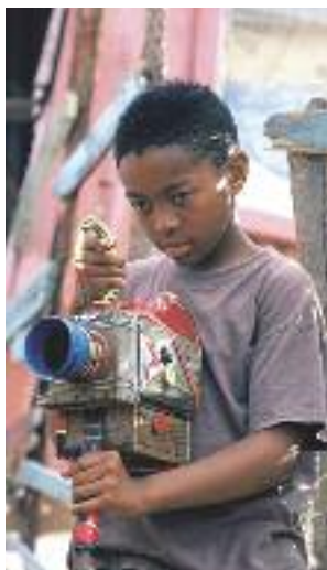
▲ la caméra de bois

(*) La force, le pouvoir ! (cri de ralliement zoulou).