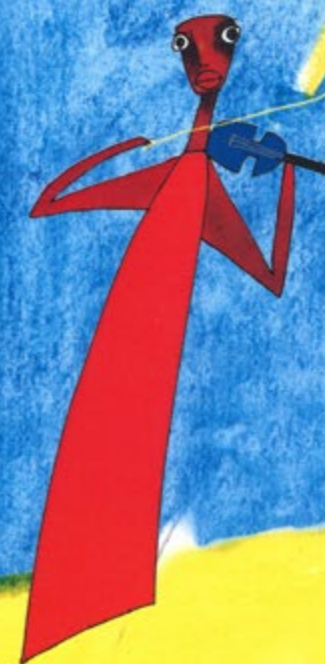
illustration Jeanne Daniel, maquette Mikael Bidault - ne pas jeter sur la voie publique